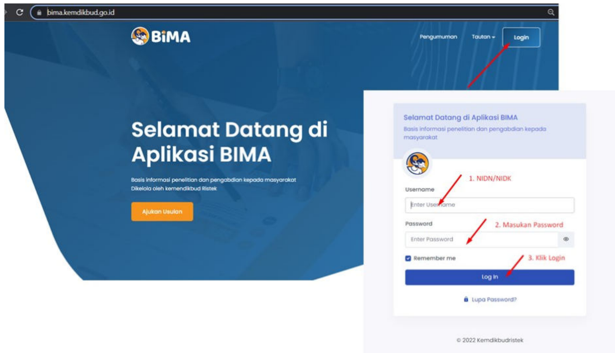
Gambar 1. Beranda akses memasuki aplikasi BIMA

Penerima pendanaan penelitian dan pengabdian kepada masyarakat di Perguruan Tinggi Akademik Tahun Anggaran 2022, wajib melakukan revisi proposal, rencana anggaran biaya (RAB), dan mengunggah surat pernyataan kesanggupan pelaksanaan melalui aplikasi BIMA pada laman http://bima.kemdikbud.go.id/ dengan menggunakan akun ketua pengusul masing-masing, sebagaimana diperlihatkan pada Gambar 1.